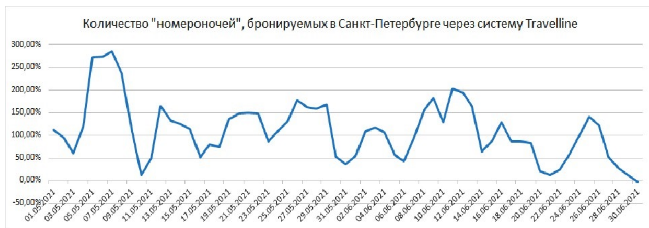
Изменение количество номерночей, бронируемых в С.-Петербурге через систему Travelline

Количество номерночей (room nights), бронируемых через систему TravelLine, показало полутора-двукратный прирост по большинству дат в мае и июне – при сравнении количества номерночей в 2021 году с показателями 2019 года. Т. е., в системе TravelLine, даже без китайских и других иностранных туристов, отели С-Петербурга в среднем продемонстрировали очень хороший прирост в объеме продаваемых ночей. Как такое оказалось возможным, при том что 2019-й год был очень успешным для большинства отельеров города - вопрос! Возможно, отельеры стали активнее продаваться через TravelLine.